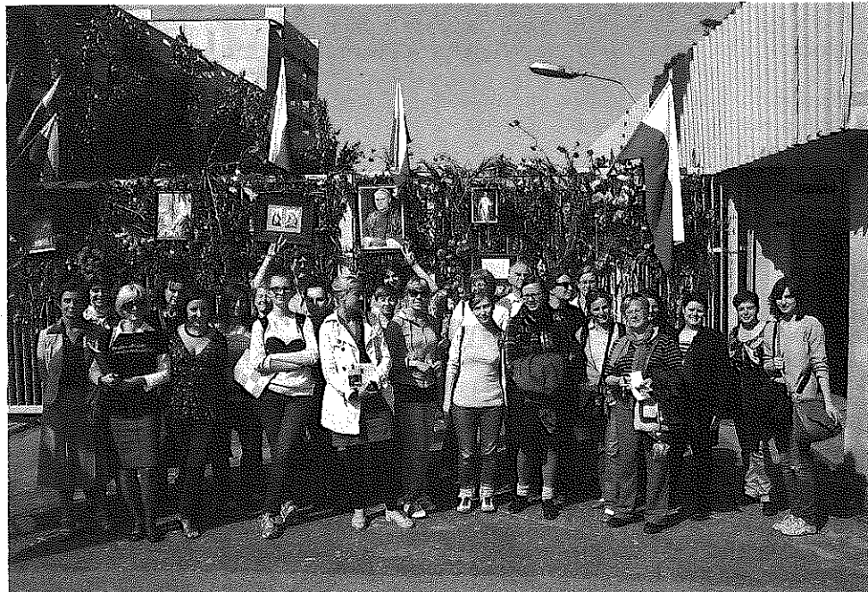
Po Stoczní Gdańskiej szlakiem kobiet oprowadza grupa społeczna Metropolitanka.